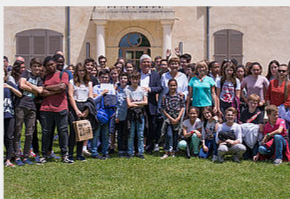
Animations Energie Positive