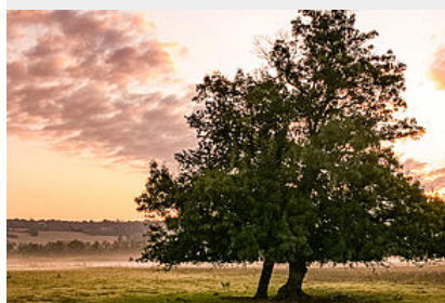
Programme 7000 arbres