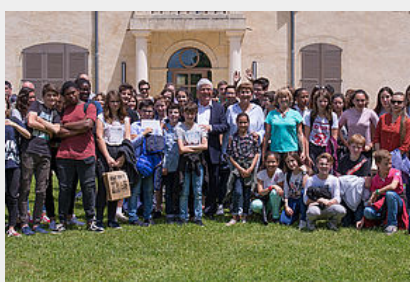
Animations Energie Positive