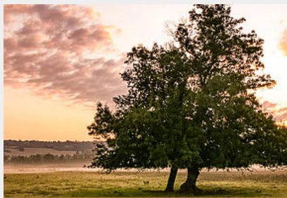
Programme 7000 arbres