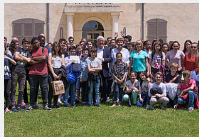
Animations Energie Positive