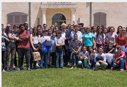
Animations Energie Positive