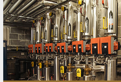
Filière bois énergie