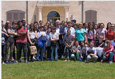
Animations Energie Positive